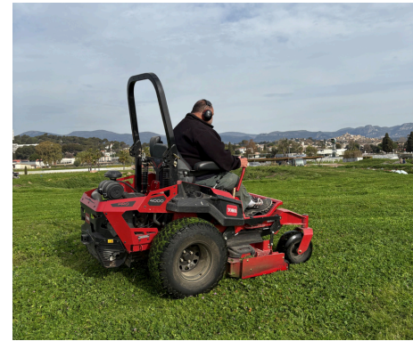
Entretien des espaces verts