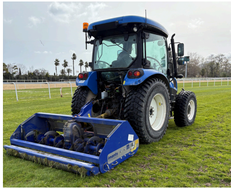
Décompactage du terrain