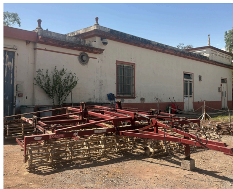
Travaux de ferronnerie sur le matériel agricole dédié à l'entretien des pistes