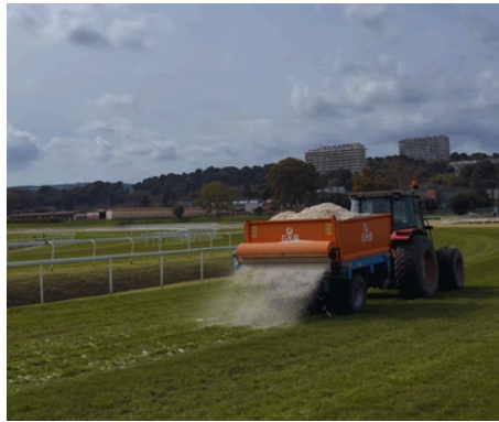
Sablage des pistes