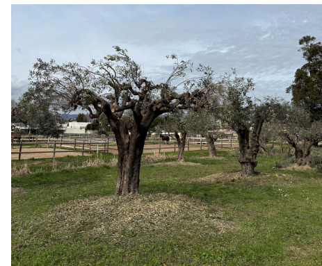
Taille des oliviers, broyage des branches et des feuilles, méthanisation des végétaux