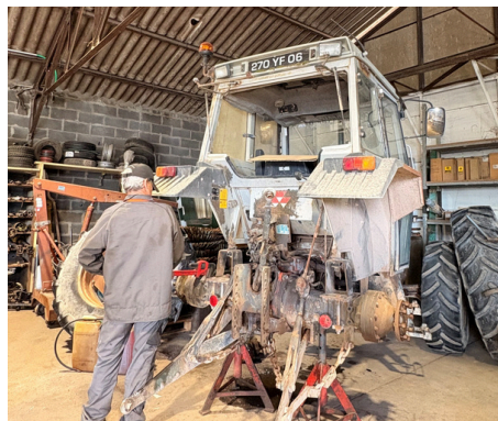
Suivi et maintenance des engins agricoles