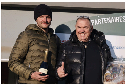
Scuderia Aichner : Meilleur Propriétaire du Meeting