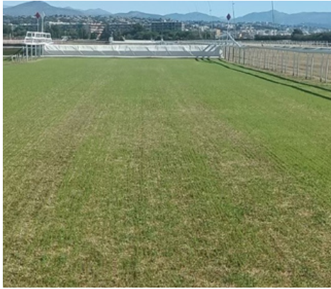
APRÈS 8 JOURS DE PLANTATION