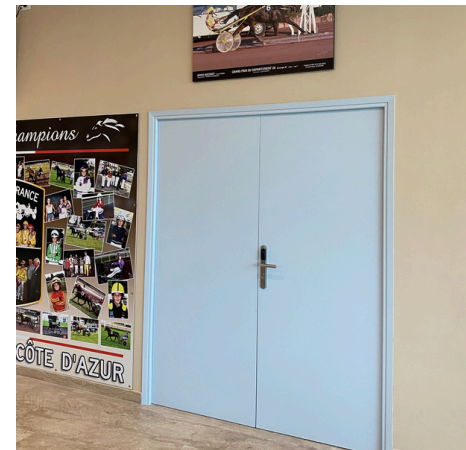
Rafraîchissement de la peinture dans la Salle des Balances