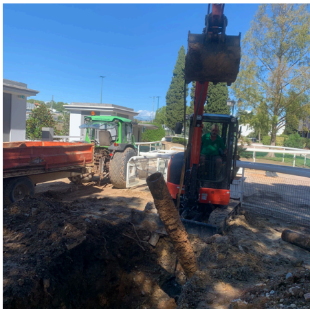
Remplacement des anciennes canalisations