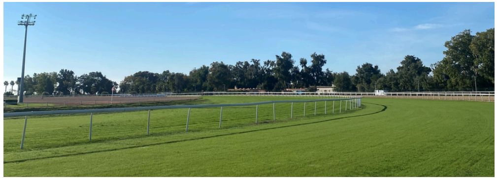
APRÈS 25 JOURS DE PLANTATION