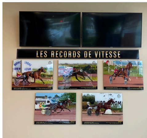
Mise à jour des photos sur le mur des Records de Vitesse